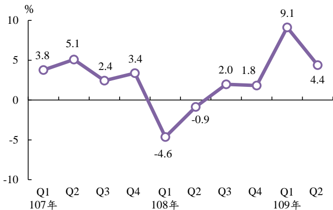
工業生產指數年增率