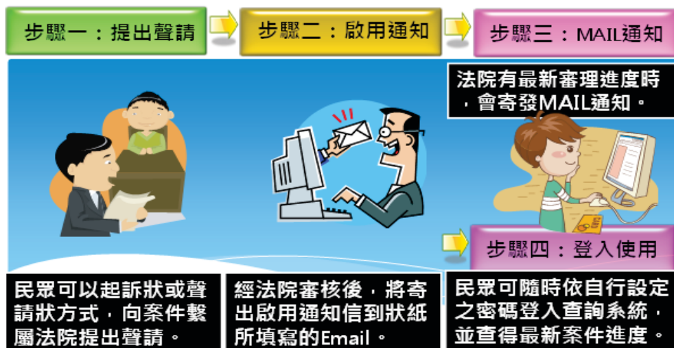
圖 3 聲請流程圖