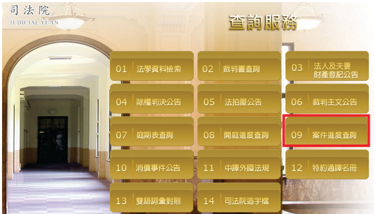
圖 5 司法院網站所提供之各項便民查詢服務