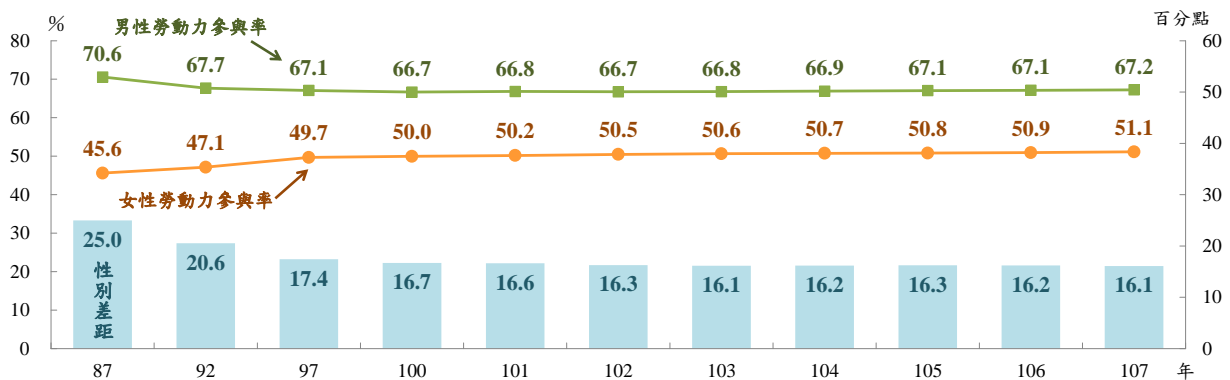
勞動力參與率及性別差距

二、依 2017 年主要國家兩性勞參率觀察，我國女性勞參率 50.9%，明顯較歐美主要國家為低，與男性勞參率差距達 16.2 個百分點，大於瑞典（4.9 個百分點）、丹麥（8.2）及美國（12.1）等主要歐美國家 ① ，若與亞鄰國家相較，則與新加坡（16.2）相仿，惟低於日本（19.4）及南韓（21.4）。