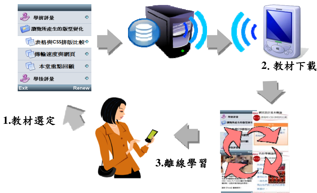
可攜式課程使用示意圖

隨著無線網路的普及與隨身數位載具的發展，中小網大嚐試以離線學習模式，提供學員下載教材(格式如：影音視訊檔案、PDF、PPT 及 Office 等文件檔案)至可攜式播放器如 PDA 或手機等使用。除透過本機及 USB 等介面傳輸檔案內容外，亦可利用有線及無線網路的串流媒體進行瀏覽。